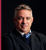
District n° 3 Michel Deschamps